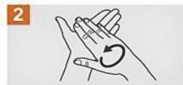
Frota las palmas de las manos entre sí.