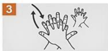
Frota la palma de la mano derecha contra el dorso de la mano izquierda, entrelazando los dedos y viceversa.