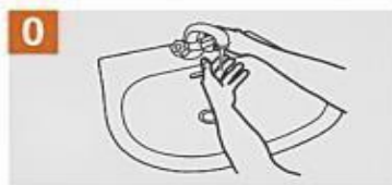
Mójate las manos con agua.