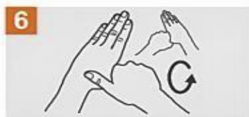
Frota con un movimiento de rotación el pulgar izquierdo, atrapándolo con la palma de la mano derecha y viceversa.