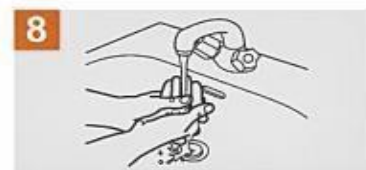
Enjuaga tus manos con agua.