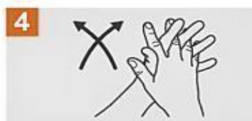
Frota las palmas de las manos entre sí, con los dedos entrelazados.