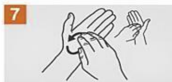
Frota la punta de los dedos de tu mano derecha contra la palma de la mano izquierda, haciendo un movimiento de rotación y viceversa.