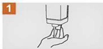
Deposita en la palma de la mano una cantidad de jabón suficiente para cubrir todas las superficies de las manos.