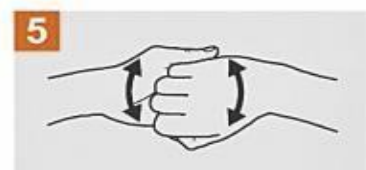
Frota el dorso de los dedos de una mano con la palma de la mano opuesta, agarrándote los dedos.